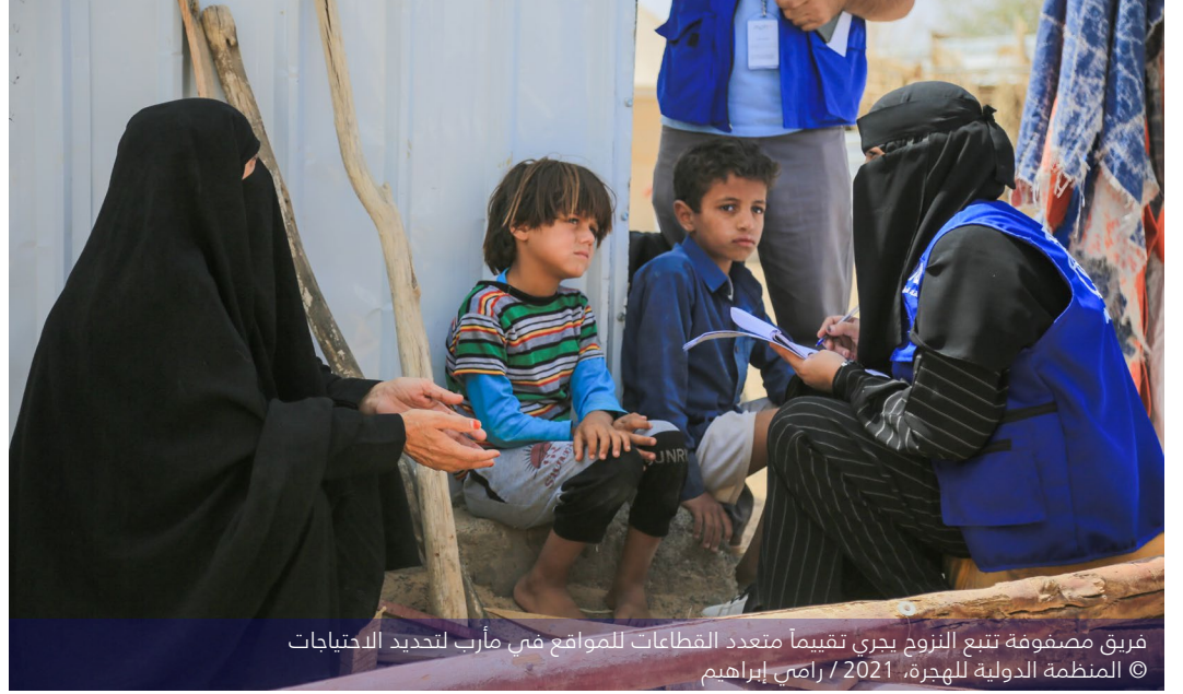
فريق مصفوفة تتبع النزوح يجري تقيماً متعدد القطاعات للمواقع في مأرب لتحديد الاحتياجات

مهاجراً يمينياً عائداً تم تسجيلهم حديثاً