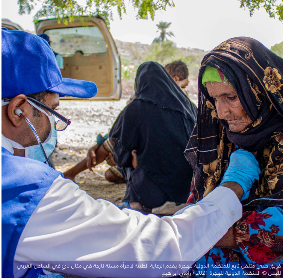
فريق طبي متنقل تابع للمنظمة الدولية للهجرة يقدم الرعاية الطبية لامرأة مسنة نازحة في مكان نائي في الساحل الغربي لليمن

مرفقاً صحياً تسلم إمدادات طبية، ومعدات، ووقود، وحوافز مالية لدعم تقديم الخدمات