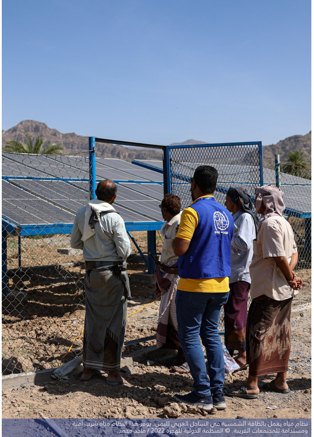
نظام مياه يعمل بالطاقة الشمسية في الساحل الغربي لليمن، يوفر هذا النظام مياه شرب آمنة ومستدامة للمجتمعات القريبة.

شخص حصلوا على الدعم بإدارة المخلفات الصلبة وحملات التنظيف المجتمعية