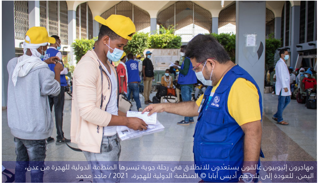
مهاجرون إثيوبيون عالمون يستعدون للانطلاق في رحلة جوية تيسرها المنظمة الدولية للهجرة من عدن، اليمن، للعودة إلى بلادهم أديس أبابا

شخصاً استفادوا من الإدارة المتخصصة لحالات الحماية ودعم الإحالة